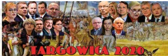
TARGOWICA 2020 - 16.01.2020.

To co zrobili w PE Europosłowie opozycji jest jawnym wystąpieniem przeciwko interesom Polski. Żyjemy w demokratycznym, praworządnym państwie. Niestety opozycja w imię własnych interesów politycznych godzi w polską rację stanu - oświadczył szef KPRM Michał Dworczyk.