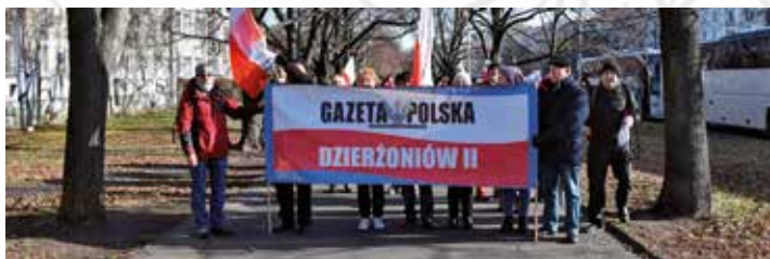
Demonstracja poparcia reformy sądownictwa. „Ani kroku w tył” - 08.02.2020.