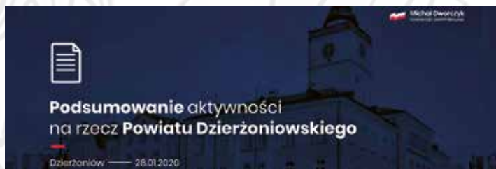
Michał Dworczyk - Podsumowanie działalności na rzecz Powiatu Dzierżoniowskiego - 28.01.2020.

To co zrobili w PE Europosłowie opozycji jest jawnym wystąpieniem przeciwko interesom Polski. Żyjemy w demokratycznym, praworządnym państwie. Niestety opozycja w imię własnych interesów politycznych godzi w polską rację stanu - oświadczył szef KPRM Michał Dworczyk.