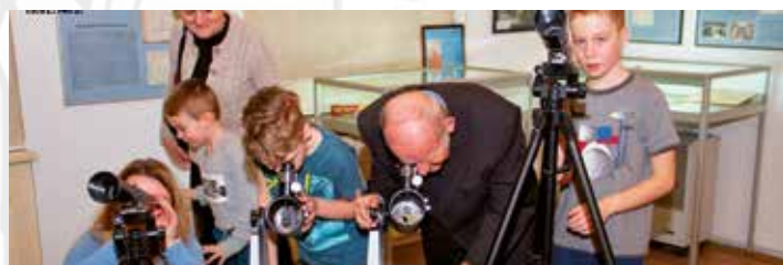
„Podglądanie kosmosu. Od lunety Galileusza do teleskopów kosmicznych” - 19 lutego 2020.

Prezydent Andrzej Duda podpisał ustawę z dnia 20 grudnia 2019 r. o zmianie ustawy – Prawo o ustroju sądów powszechnych, ustawy o Sądzie Najwyższym oraz niektórych innych ustaw.