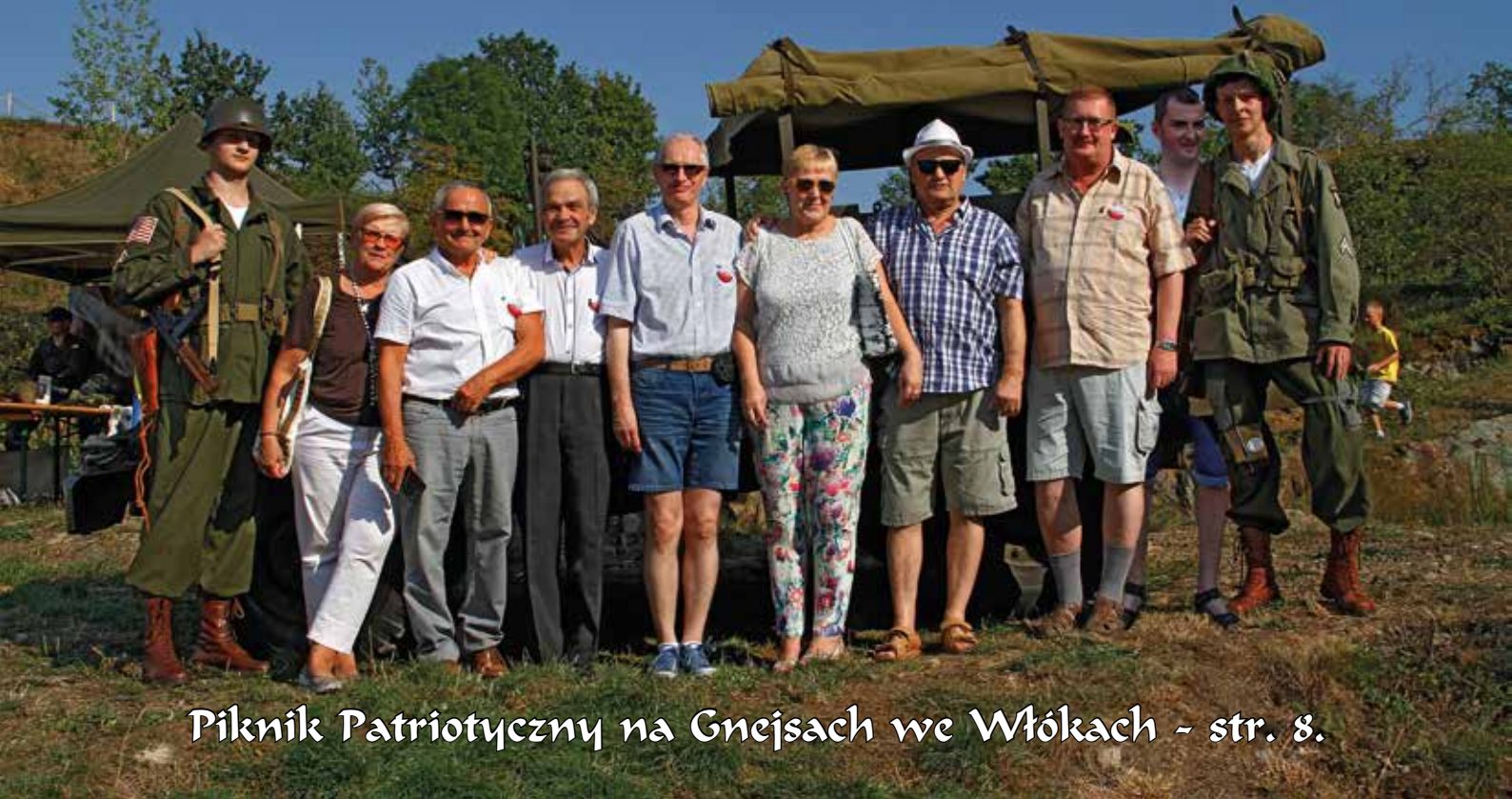
Piknik Patriotyczny na Gnejsach we Włókach - str. 8.